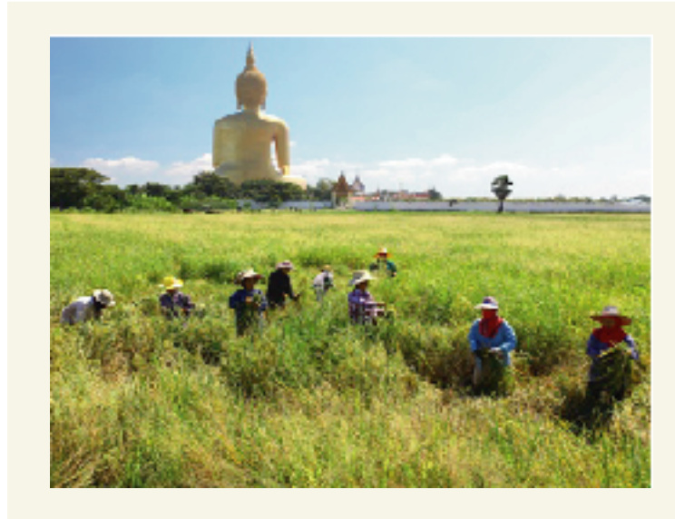
"ร่วมมือร่วมใจ"