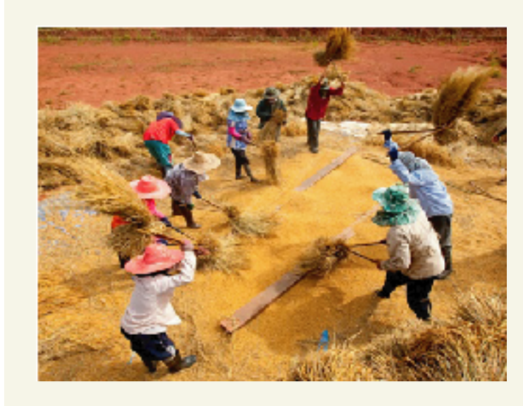
"คลังเสบียง"