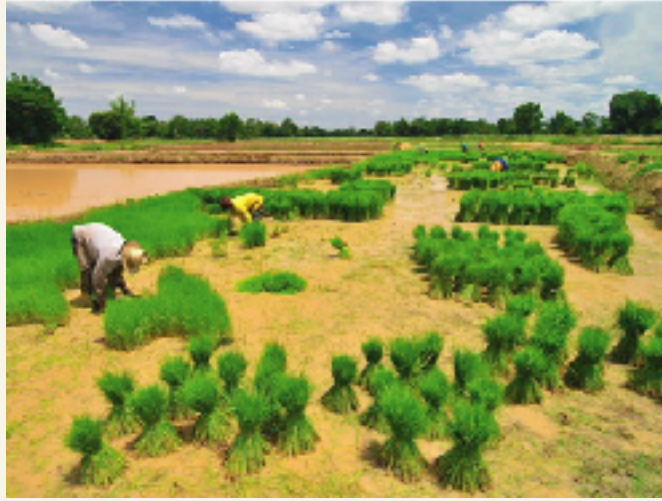
"หลังสุ่ฟ้า หน้าสู่ดิน"