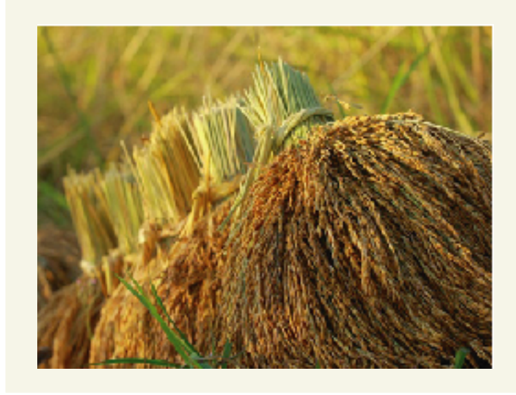
"ล่านเมล็ด"