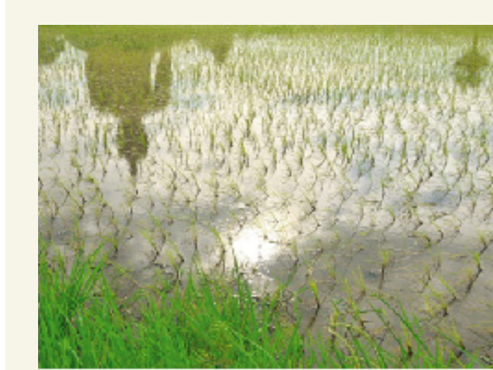
"ทรัพย์ในนา"