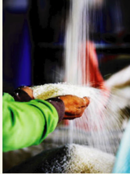
"อุ่มข้าว"