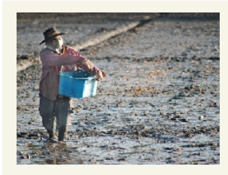
"ทว่านข้าว"