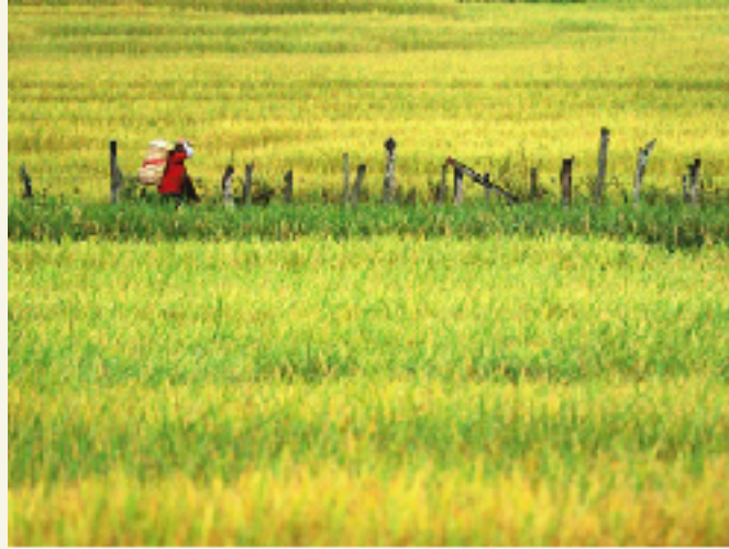
"กลับบ้าน"